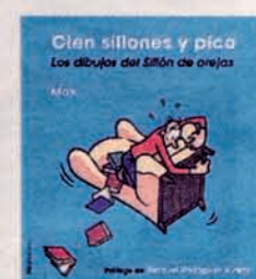
CIEN SILLONES Y PICO Max. Nórdicalibros. 130 páginas. 22,50 euros.