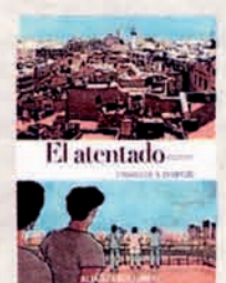
EL ATENTADO Adaptación del libro de Yasmina Khadra por L. Dauvillier. Ilustra Glen Chapron. Alianza. 160 páginas. 22 euros.