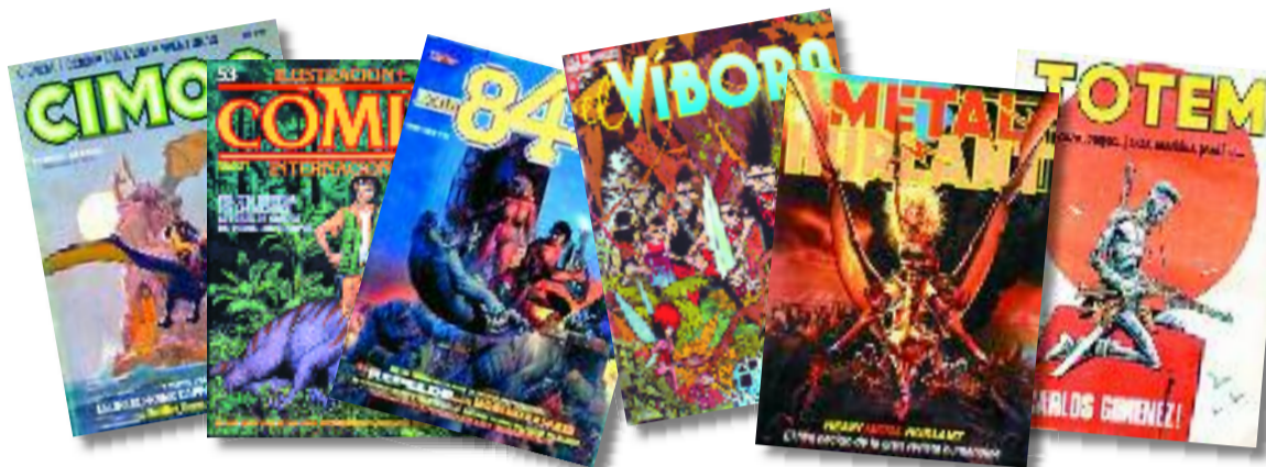
Algunos de los emblemáticos (y desaparecidos) títulos de la edad de oro de las revistas de cómic en España.

Juan Carlos Hidalgo laopinion.comic@epi.es