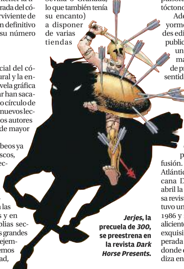
Jerjes , la precuela de 300 , se preestrena en la revista Dark Horse Presents .

Además, con un carácter mayormente publicitario, las grandes editoriales han comenzado a publicar revistas que sirven como un muestrario de sus series más exitosas o como anticipo de próximas novedades. En este sentido podemos reseñar Vertigo Magazine , en la que Planeta de Agostini promociona los títulos de la línea adulta de DC (emporio Warner), un riesgo minimizado al ser historietas de consabido corte comercial que simplemente buscan mayor difusión. También, al otro lado del Atlántico, la editorial norteamericana Dark Horse anuncia para abril la recuperación de su famosa revista Dark Horse Presents , que tuvo una vida digna entre los años 1986 y 2000. Ahora vuelve con el aliciente de mostrarnos, entre otras exquisiteces, el anticipo de la esperada obra de Frank Miller Jerjes , donde el autor de Sin City profundiza en la leyenda del rey persa.