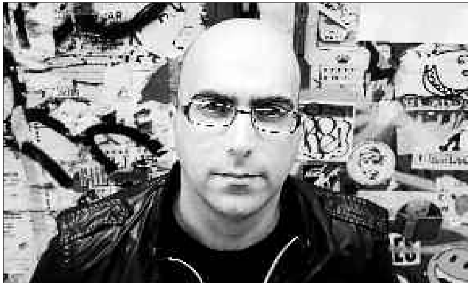
El escritor Valter Hugo Mãe, la última revelación portuguesa.

► En una remota región de Suecia, Erik Hall, un submarinista aficionado, descubre un cadáver en el fondo de una vieja mina inundada. Junto al cuerpo aparecen inscripciones de un antiguo poema islandés y una cruz ansada, el símbolo egipcio de la vida. El hallazgo llegará a manos del excéntrico historiador Don Titelman, un experto en nazismo y símbolos religiosos y ocultistas, que se verá inmerso en una intriga de consecuencias imprevisibles.