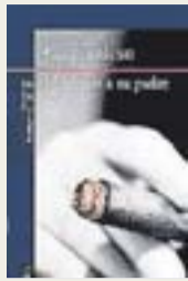
HONRARÁS A TU PADRE Autor: Gay Talese. Ensayo. Editorial: Alfaguara. 600 páginas. Precio: 21,50 euros

Además de para volver a acompañar a Talese en uno de sus trabajos de implicaciones cuestionables (recuerden 'La mujer de tu prójimo' con aquellos masajes y aquellos intercambios de pareja), el libro sirve para que se vuelva a dar el deslumbramiento de la prosa periodística de un autor que es considerado con justeza uno de los maes-