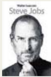
STEVE JOBS: LA BIOGRAFÍA Autor: Walter Isaacson. Editorial: Debate. 744 páginas. Precio: 23,90 euros

'Honrarás a tu padre' es una historia de mafiosos y también una de buenos ciudadanos estadounidenses. Uno de los aciertos del libro consiste en dejar claro que los Bonanno son al mismo tiempo unos delincuentes y una extraña familia de orden entregada al sueño americano. Gay Talese abre esas puertas inquietantes en esta crónica monumental del crimen organizado.