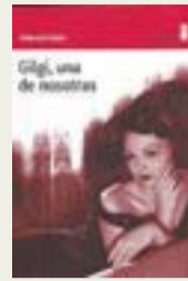
GILGI, UNA DE NOSOTRAS Autora: Irmgard Keun. Novela. Editorial: Minúscula. Páginas: 216. Precio: 16,83 euros.