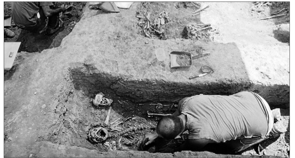
Detalle de la exhumación de las fosas de San Rafael. GREGORIO TORRES

El texto tiene vocación holística y complementa la mirada de los diferentes territorios con un acercamiento especializado a capítulos enraizados en el conflicto; la cruzada antimasonía, el exilio, el fo-