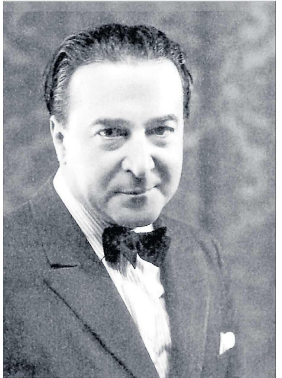
Julio Camba (1882-1962).

Y cosa difícil en la carrera de fondo que es escribir una columna llueva o truene, acudan o no las Musas, el periodista es capaz de convertir en obra de arte el tema más nimio o manido. Así, en esta recopilación una de sus mejores piezas es El mar : «El mar es muy inferior a su fama. Si vale algo es en el sentido industrial, como pescadería y como vía de comunicación», afirma. También es capaz de sacarle punta a la «decadencia de los bigotes franceses», a las diligencias o incluso a la falta de aventuras en los sosos viajes actuales. Cualquier material, por insustan-