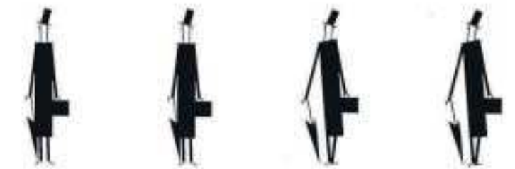
Un ejemplo del grafismo de Silvestre.

La máscara metaliteraria debutó a mediados de los noventa en el número 2 de la revista franco-belga Pelure Amère y se concretó rápidamente en el volumen Relations , alumbrado por la editorial francesa Amok, que, por entonces, partía la pana con sus propuestas arriesgadas. Hasta la fecha, Del Barrio nos había regalado dos álbumes excelentes, Relaciones (Sins Entido) y Simple (De Ponent), ambos publicados en 1999, el primero más deslavazado, el segundo más denso, pero no menos juguetón. Y ahora que casi se cumplen veinte años de aquella interesantísima duología, llega a libre-