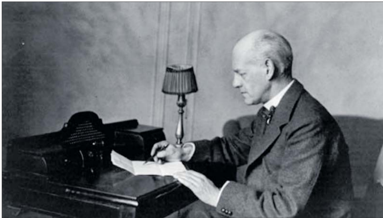
John Galsworthy, premio Nobel de Literatura en 1932.