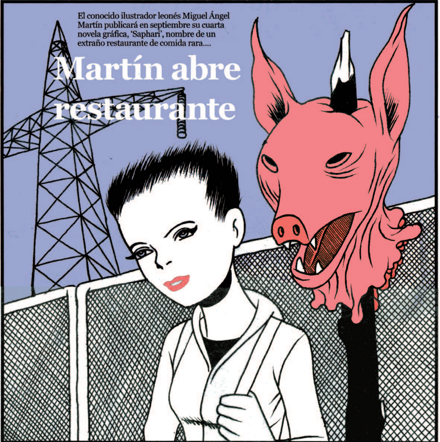
DETALLE DE LA PORTADA DE LA NOVELA 'SAPHARI'

● novedad LOS TITANES EN FEMENINO Kami García reinventa a los superhéroes con 'Raven'