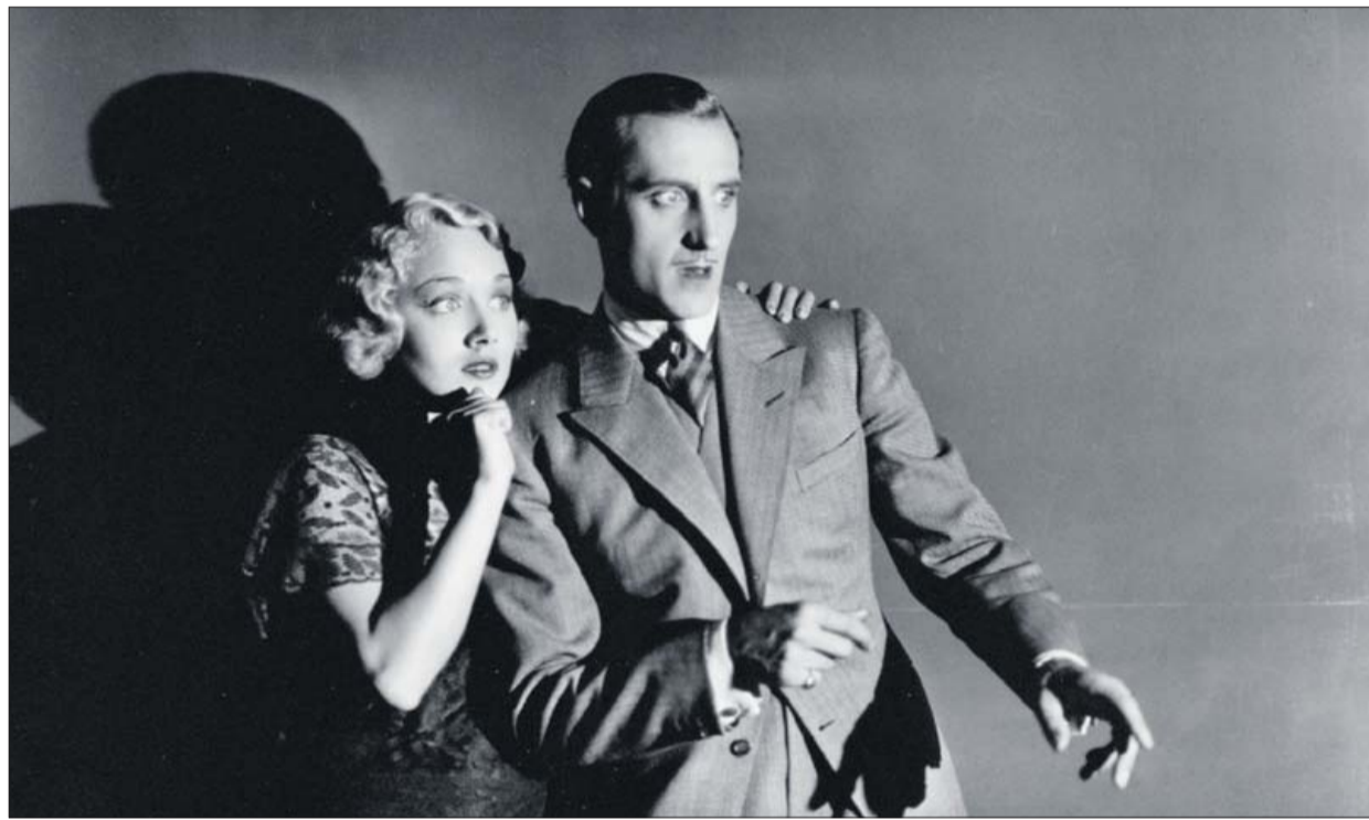
El futuro 'Sherlock Holmes', Basil Rathbone, en 'El caso de los asesinatos del obispo'. L. O.

► Precisa y delicada, esta novela mira hacia lo más íntimo para iluminar las incógnitas que marcan una existencia, aquellas sobre las que construimos nuestra identidad: la memoria como herida y como refugio, el abandono y la pérdida de la inocencia, la complejidad de los lazos familiares y amorosos... Finalista del prestigioso premio Strega y elogiada por la crítica, esta obra sitúa a Nadia Terranova entre las voces más interesantes de la narrativa italiana actual.