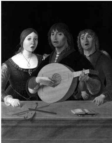
Un concerto (1490), de Lorenzo Costa.